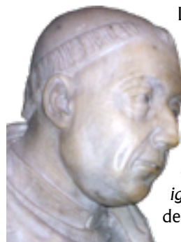
Nicolas de Cuse (1401-1464)

À l'endroit où j'écris ces lignes, assis devant une fenêtre, le temps dehors est très changeant. Cependant, ici, le bulletin météo est à peu près toujours le même : « ensoleillé avec averses intermittentes » ou « averses entrecoupées d'éclaircies ». Il faut apprendre à l'accueillir et à vivre avec. Bien sûr, les extrêmes, inondations ou sécheresses, font la une des journaux ; mais ici, le temps qu'il fait est principalement un sujet occasionnel de conversation, un moyen sûr et universel de s'ajuster avec d'autres au monde dans lequel nous habitons tous ensemble et, peut-être, un code météorologique pour composer avec les forces autonomes de la vie qui échappent à notre contrôle. Belle journée, espérons que ça va durer. Quel temps affreux, mais la météo annonce...