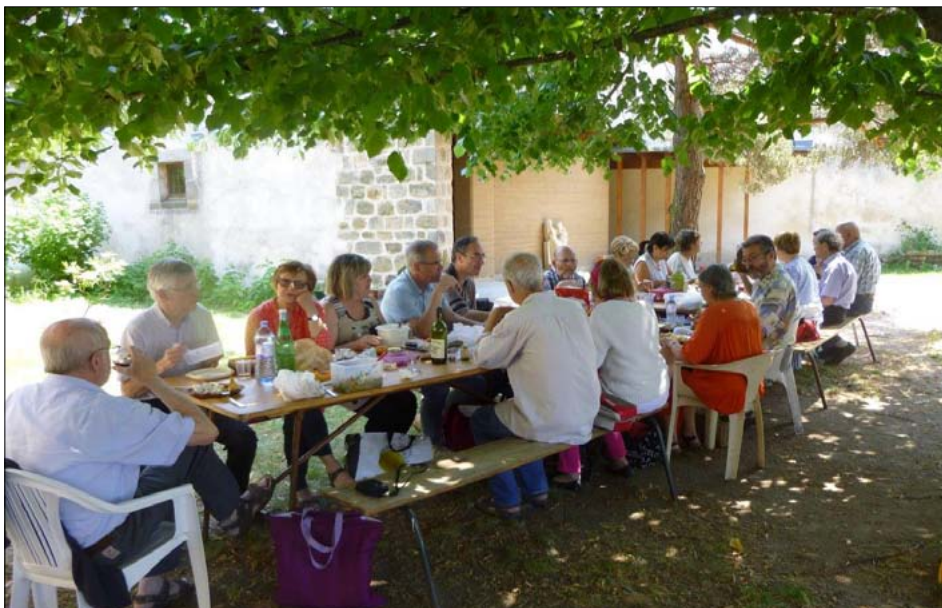
Déjeuner sous le tilleul.

L'oratoire, avec sa très belle statue de la Vierge à l'Enfant, nous a permis de pratiquer deux temps de méditation dans la matinée : le premier en arrivant et le deuxième avant le repas. Le silence nous a réunis dans l'attention aux autres et la simplicité.