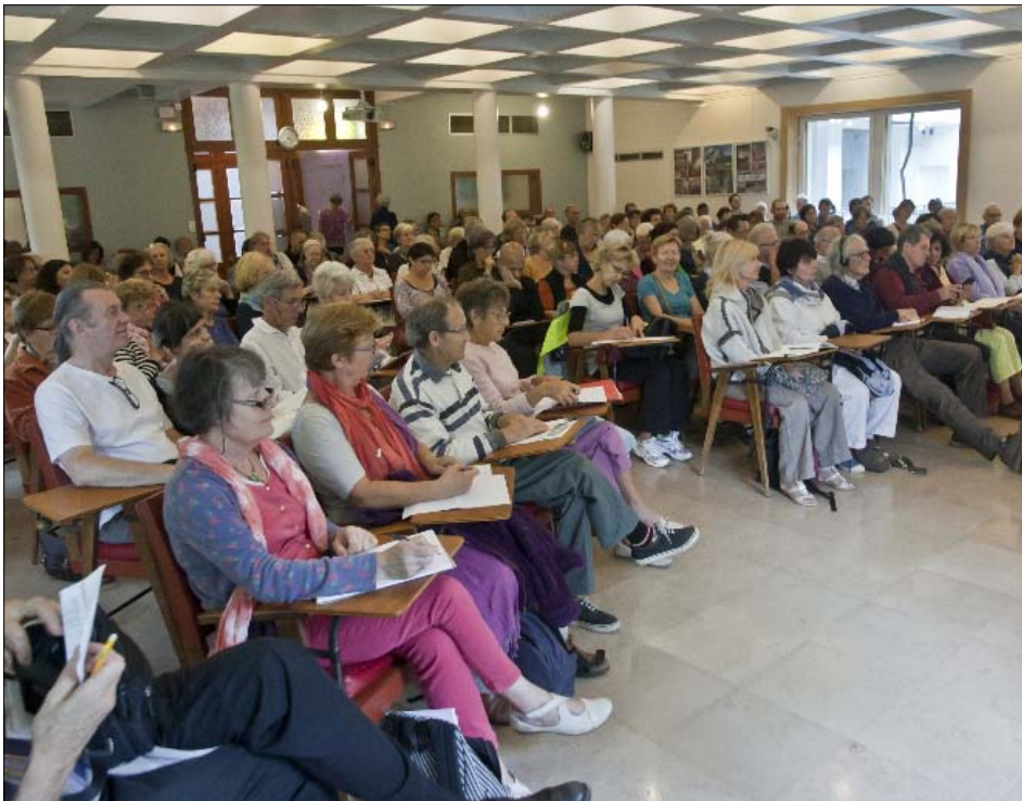
Quelque 150 personnes, venues de toute la France, de Suisse et de Belgique, au centre de la Roche d'Or.

Après l'averse, la lumière se faufile houle apaisée des souffles mêlés trilles de l'oiseau moqueur